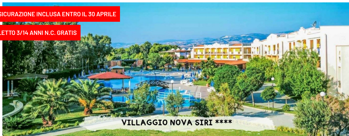
VILLAGGIO NOVA SIRI ****

quote a persona in pensione completa con bevande incluse ai pasti