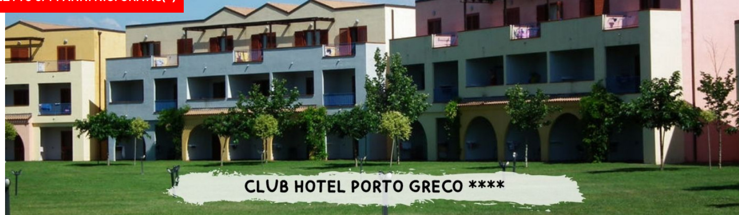
CLUB HOTEL PORTO GRECO ****

quote a persona in pensione completa - bevande incluse in formula "mondotondo club"