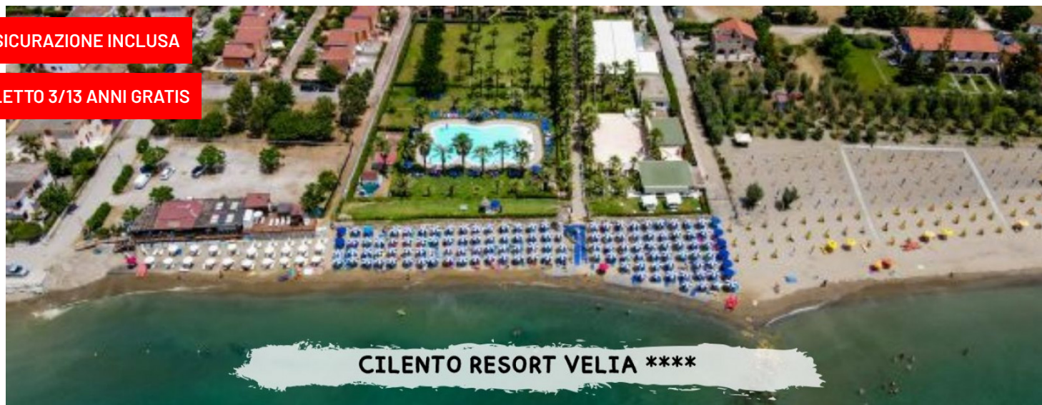
CILENTO RESORT VELIA ****

quote a persona in camera doppia (in camera bungalow o cottage) pensione completa (*) – bevande incluse