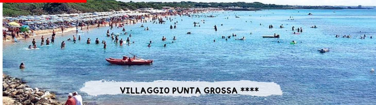
VILLAGGIO PUNTA GROSSA ****