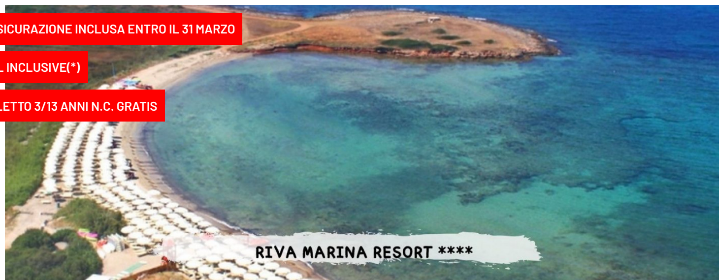
RIVA MARINA RESORT ****