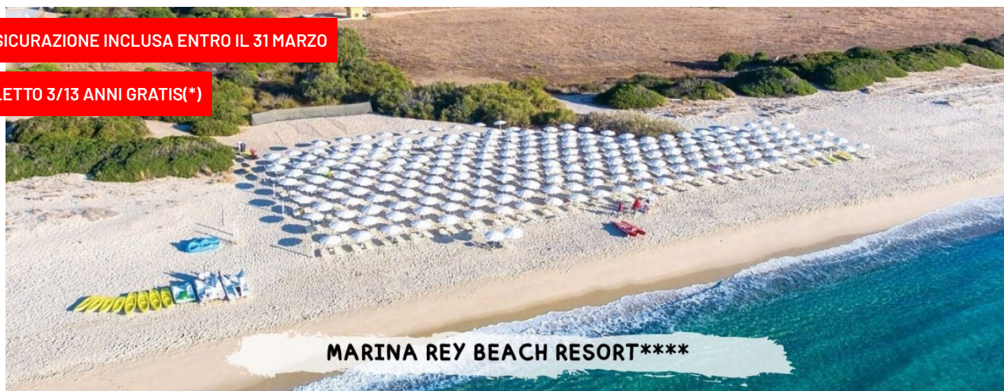
MARINA REY BEACH RESORT****

PER LE TUE SETTIMANE SPECIALI CLICCA QUI