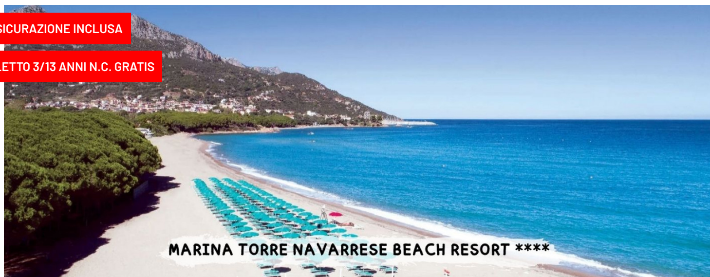
MARINA TORRE NAVARRESE BEACH RESORT ****