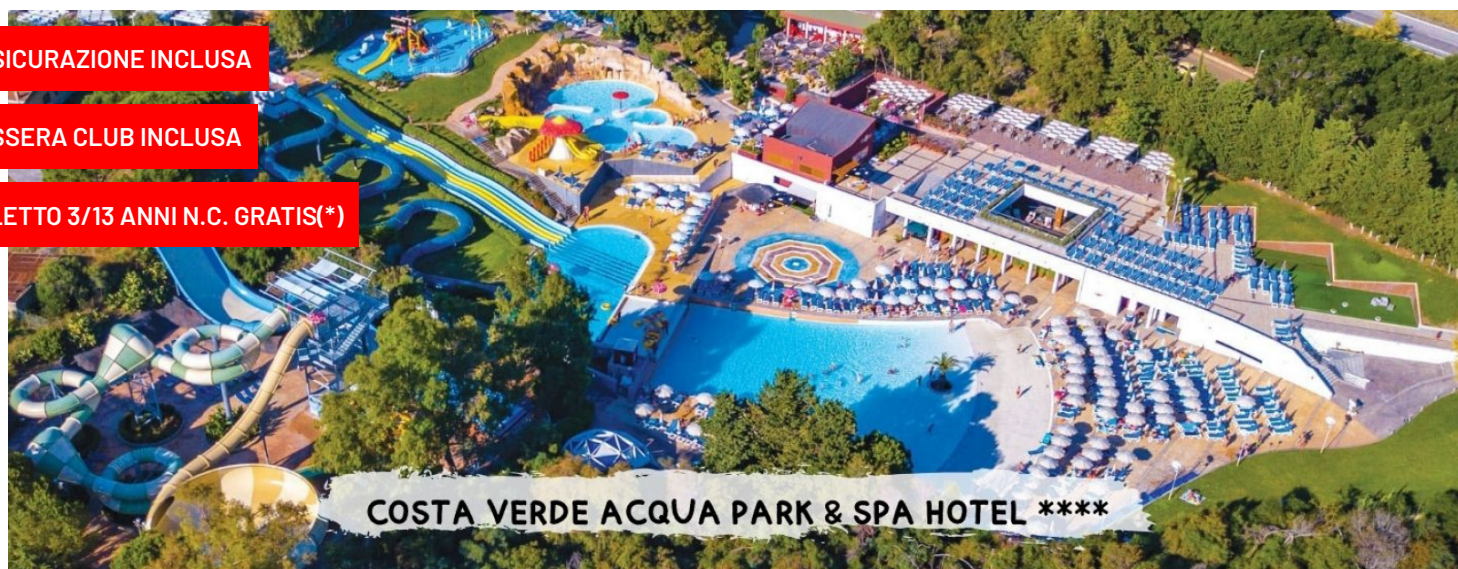
COSTA VERDE ACQUA PARK &amp; SPA HOTEL ****