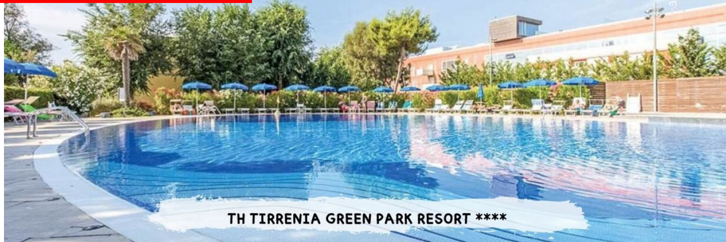
TH TIRRENIA GREEN PARK RESORT ****

PRENOTA PRIMA GARANTITO FINO AL 15 MARZO